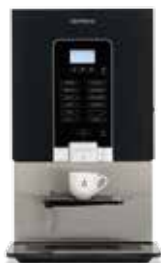
OptiVend 32 TS NG