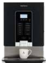
OptiVend 32 NG