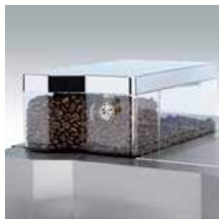
+ Свежие кофейные зерна