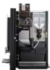
ОВ 3 (XL) NG