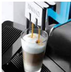
+ Большой выбор напитков на основе эспрессо, таких как латте макиато