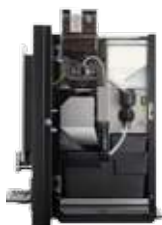
ОВ 2 (XL) NG