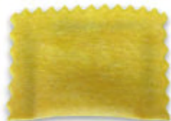
БОЛЬШОЙ ПРЯМОУГОЛЬНИК С ЗУБЧАТЫМИ КРАЯМИ 70 X H.50 MM