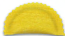
БОЛЬШОЙ ПОЛУМЕСЯЦ С ЗУБЧАТЫМИ КРАЯМИ 72 X H.49 MM