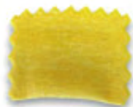
МАЛЕНЬКИЙ ПРЯМОУГОЛЬНИК С ЗУБЧАТЫМИ КРАЯМИ 50 X H.42 MM