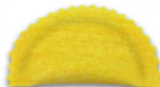
БОЛЬШОЙ ПОЛУМЕСЯЦ С ГЛАДКИМИ КРАЯМИ 72 X H.49 MM