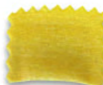
КВАДРАТНЫЙ С ЗУБЧАТЫМИ КРАЯМИ 37 X H.37 MM