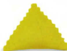
ТРЕУГОЛЬНЫЙ С ЗУБЧАТЫМИ КРАЯМИ 70 X H.40 MM