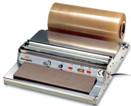
Sirman Горячие столы , model Dispenser 45 K :

Идеально подходит для упаковки таких продуктов питания как мясо, сыр, макаронные изделия, фрукты и овощи; диспенсеры работают быстро и гигиенично в супермаркетах, мясных и гастрономических магазинах и везде где продажа свежей продукции, требует ежедневного быстрого и надежного конфекционирования.