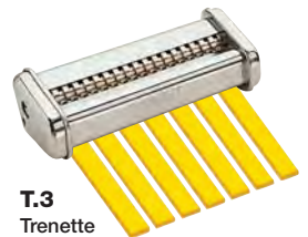
T.3 Trenette mm. 4