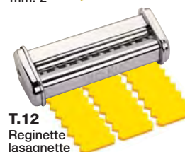
T.12 Reginette lasagnette mm. 12