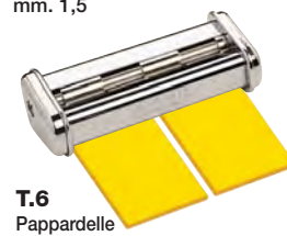
T.6 Pappardelle mm. 32