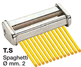
T.S Spaghetti Ø mm. 2