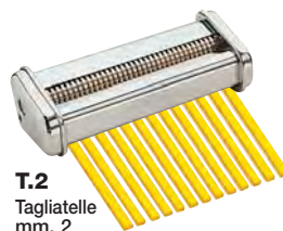
T.2 Tagliatelle mm. 2