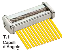
T.1 Capelli d'Angelo mm. 1,5