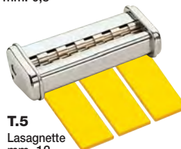
T.5 Lasagnette mm. 12