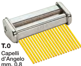
T.0 Capelli d'Angelo mm. 0,8