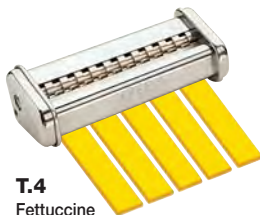
T.4 Fettuccine mm. 6,5