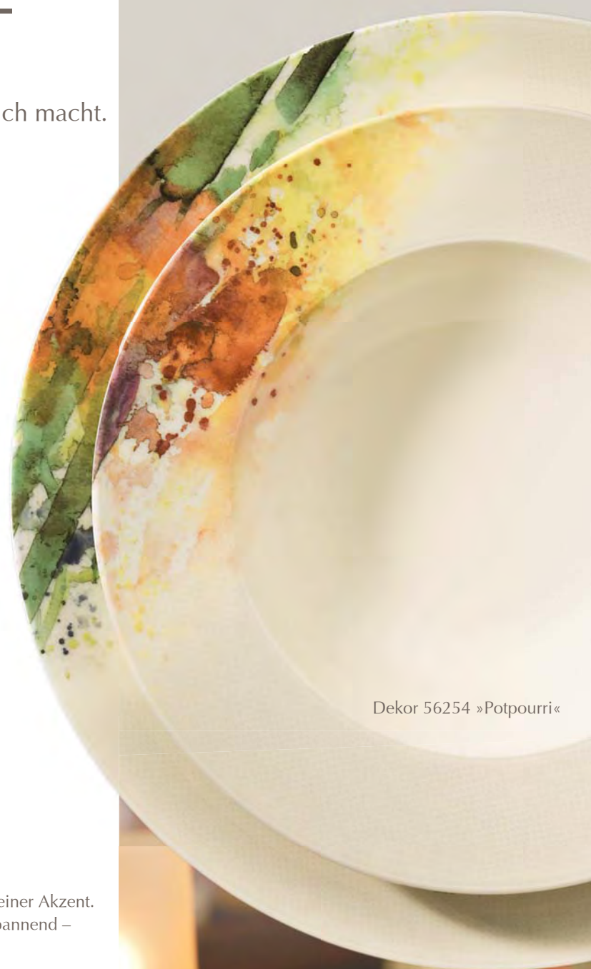
Dekor 56254 »Potpourri«