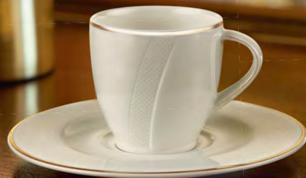
Dekor 10769 »Goldlinie«